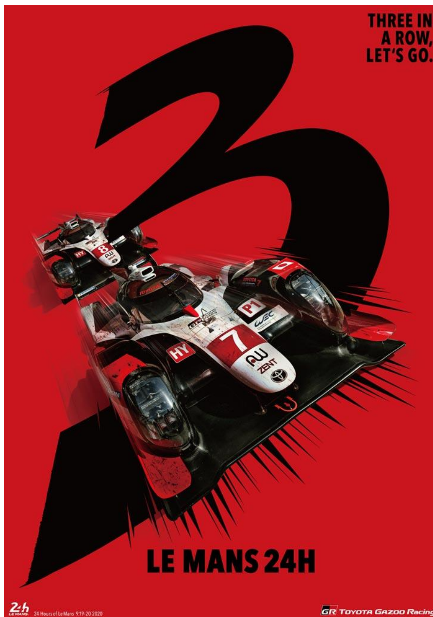
Visual de TGR para Le Mans (versión vertical)

La imagen de la campaña se puede descargar como fondo de pantalla desde el sitio web especial de TGR Le Mans.