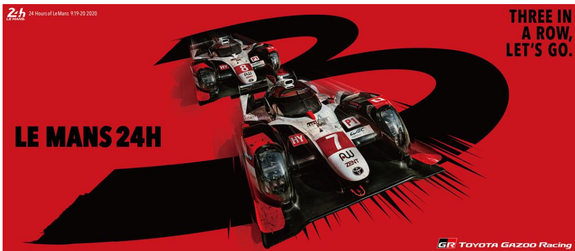
Campaña de TGR creada especialmente para Le Mans 2020

TOYOTA GAZOO Racing (TGR) lanzó el día de hoy un sitio web especial dedicado a las 24 Horas de Le Mans (que se verán en vivo el 19 y 20 de septiembre dentro del sitio web oficial de TGR). TOYOTA GAZOO Racing busca una tercera victoria consecutiva en Le Mans y busca motivar a través de una película especial que repasa la historia de carreras de la marca en Le Mans titulada " Le Mans: Our Challenge ". Durante la semana de la carrera, se programará una transmisión en vivo y las noticias más relevantes de Le Mans se publicarán en Twitter para ofrecer la información más actualizada a los fanáticos del deporte motor.